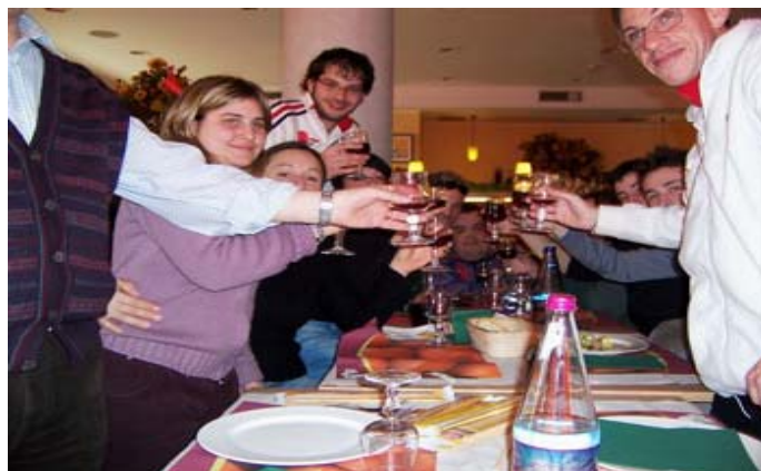
Un momento delle cena con i volontari della Croce Verde di Pinerolo

Altre immagini dell'iniziativa possono essere viste sul sito www.anpastoscana.it