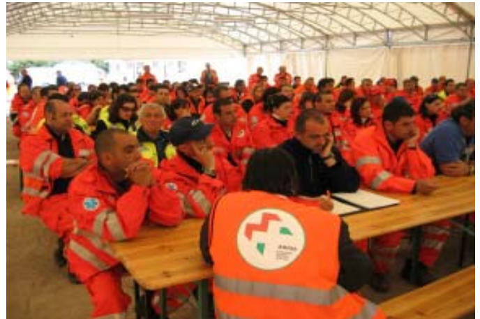
Una lezione in plenaria del corso di formazione