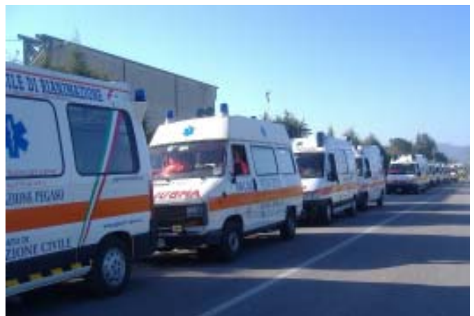
Partenza della colonna Anpas durante l'esercitazione