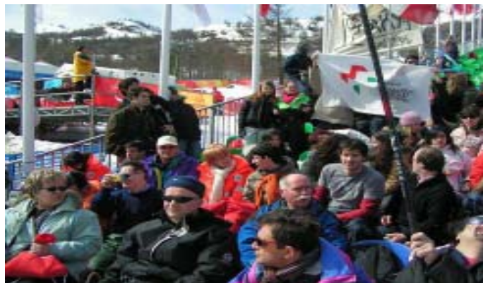
Il gruppo assiste alla cerimonia di chiusura dei giochi paralimpici

Stagista Anpas Toscana, che ha accompagnato il gruppo durante la gita