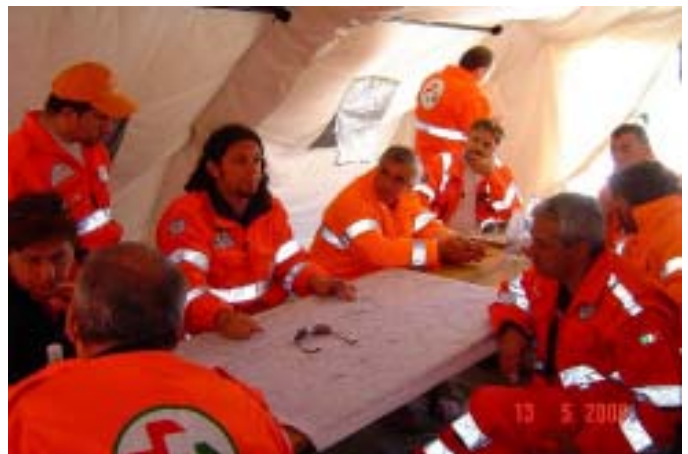
La Direzione dell'esercitazione