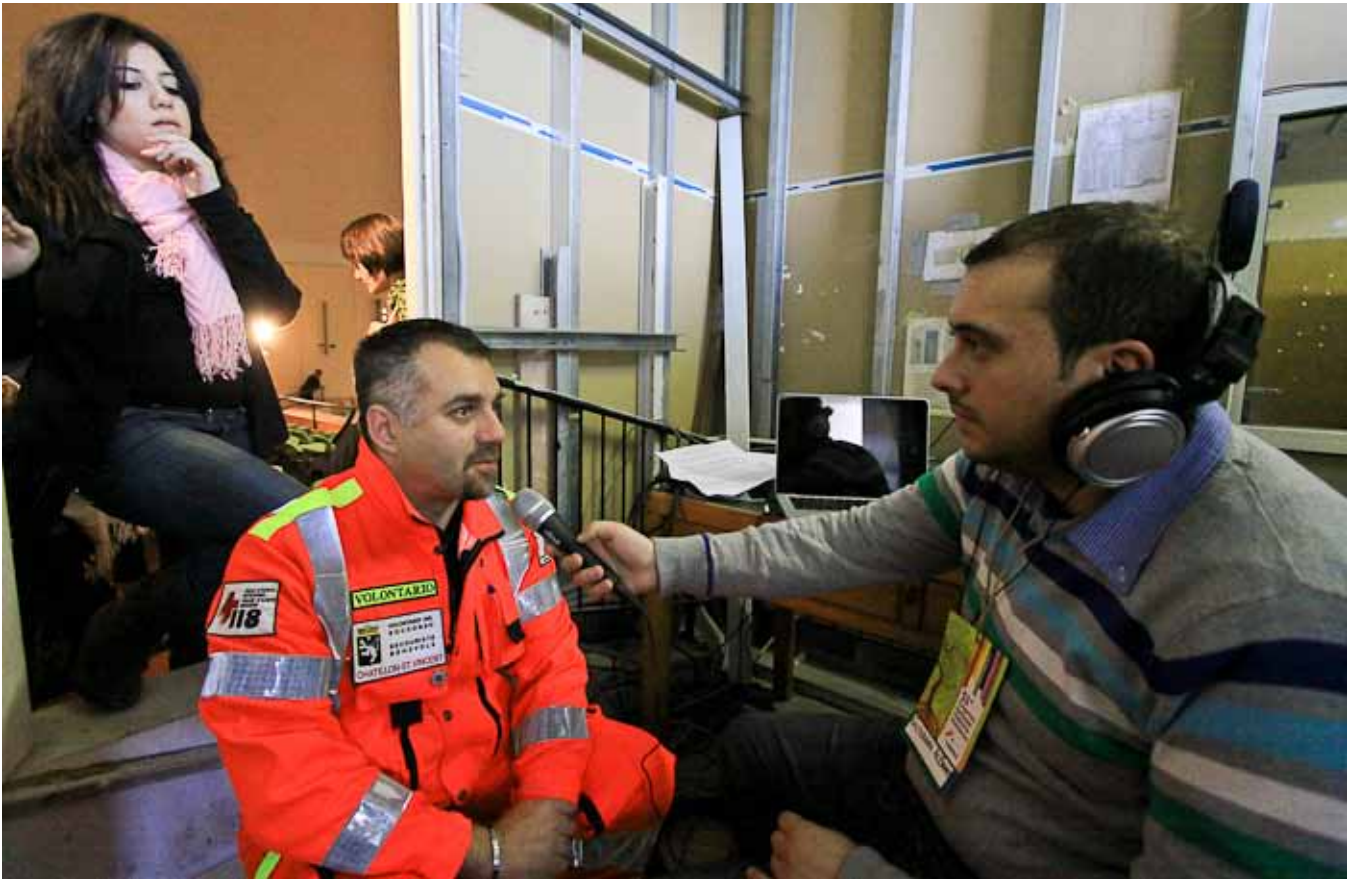
Radio Anpas Sicilia al 51° Congresso Anpas

“ Una comunicazione glocal e resiliente, monitoraggio, narrazioni e formazione diffusa ”