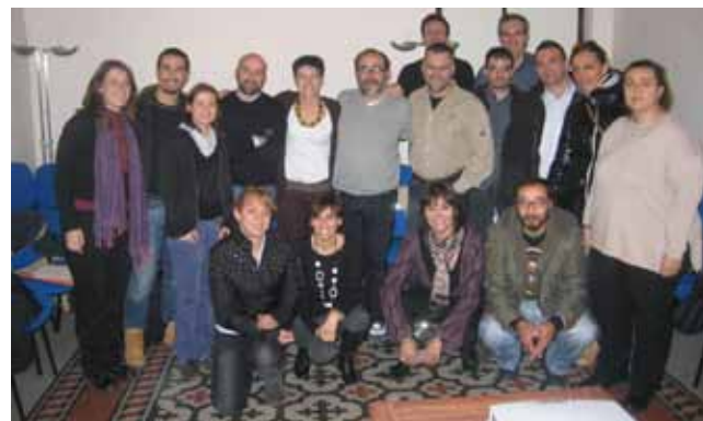
Il gruppo Europa alle giornate di formazione di Genova (a sinistra) e Roma (in alto)