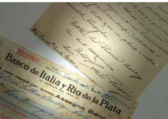
DUE DOCUMENTI DELL'ARCHIVIO STORICO ANPAS (dal volume Storie nella Storia )