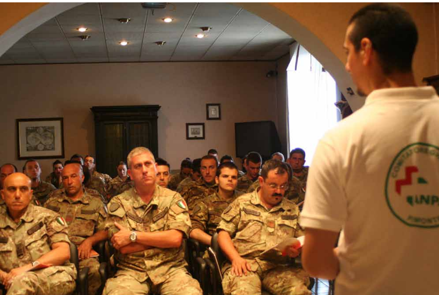
La formazione di Anpas Piemonte (in alto), un campo scuola di Protezione Civile (a fianco), Anpas al Contest Sami (a destra)