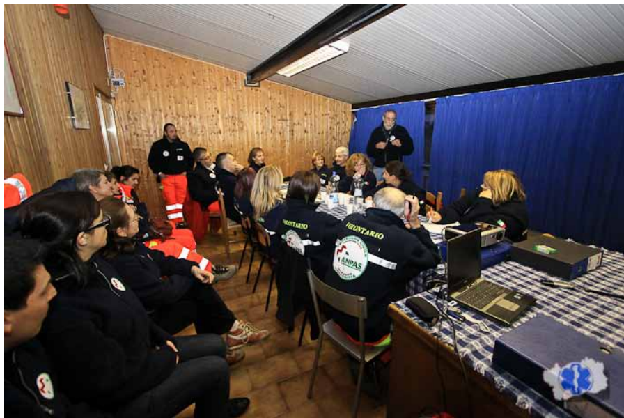
Valle d'Aosta: la sala operativa della Protezione Civile.

“ Formare non è un prodotto che si eroga in un corso sporadico, formare è azione più vicina all'educazione in cui è necessaria costanza e diffusione delle azioni. ”